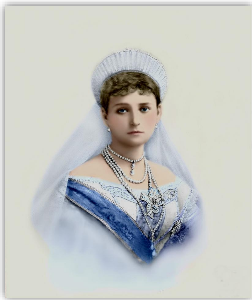
Святая царица-мученица Александра Федоровна

В октябре 1908 года императрица Александра Фёдоровна всемилостивейше соизволила пожаловать на ремонт Космодемьянской церкви 200 рублей.