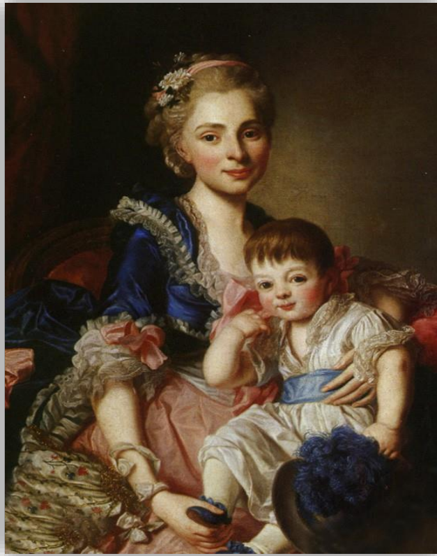
Наталья Петровна Голицына с сыном Петром 1767 г.

(17 января 1741 или 1744, Берлин, Германия – 20 декабря 1837, Санкт-Петербург)