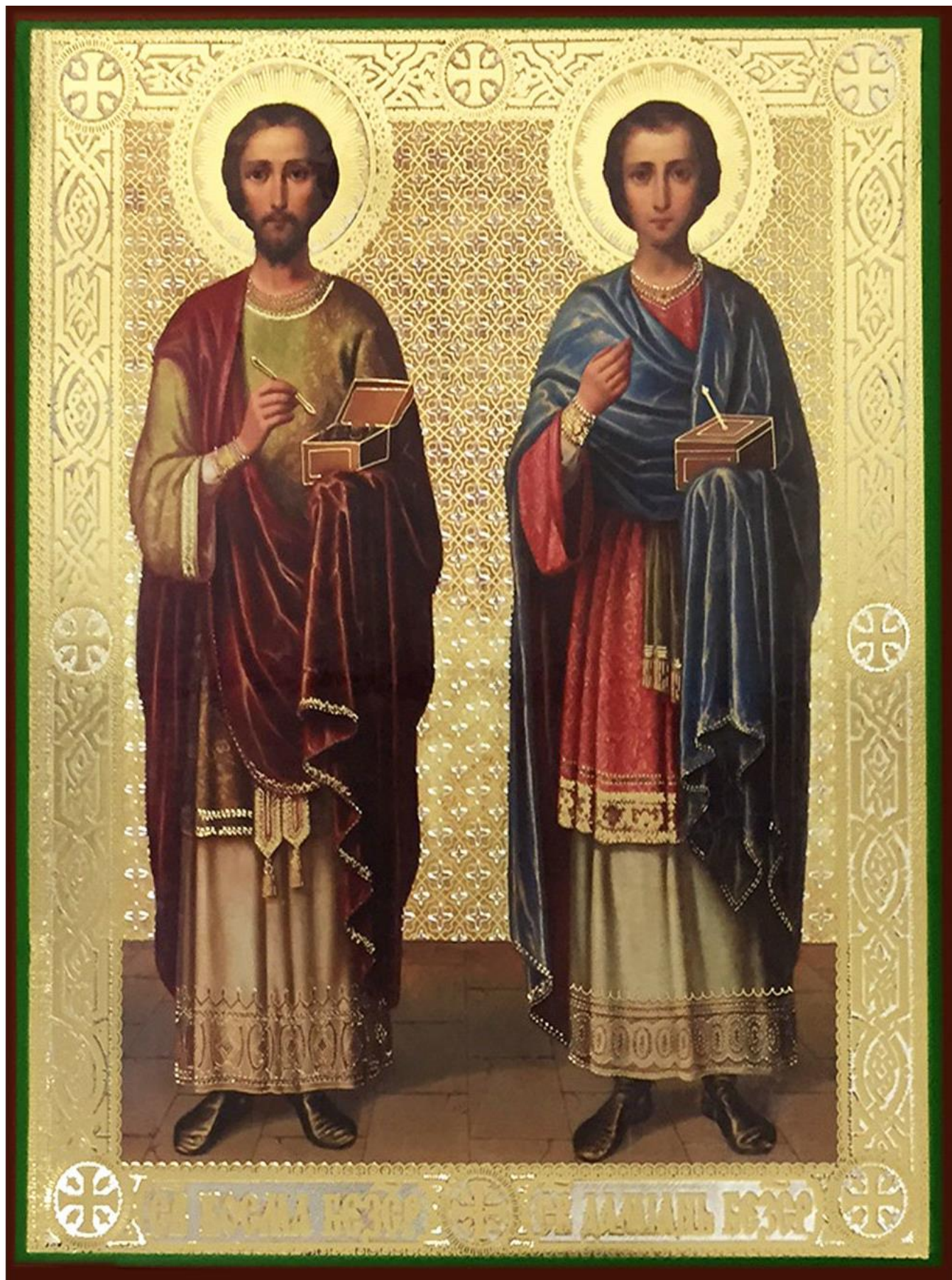
Святые бессребреники и чудотворцы Косма и Дамиан