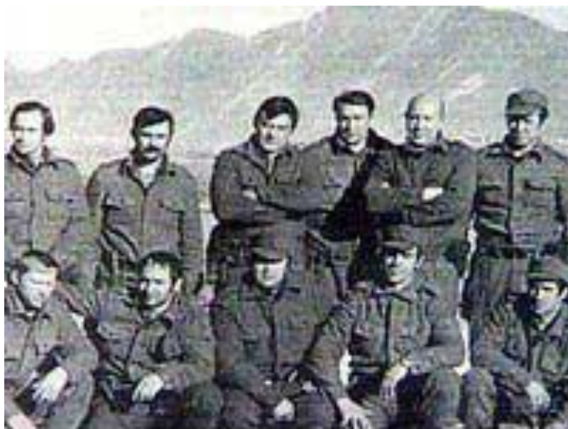
Участники штурма Дворца Амина