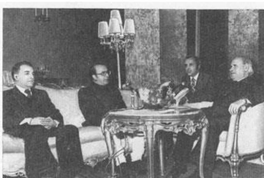
Крайний слева — Х. Амин; крайний справа — Н. М. Тараки. (За полтора месяца до убийства Н. М. Тараки)